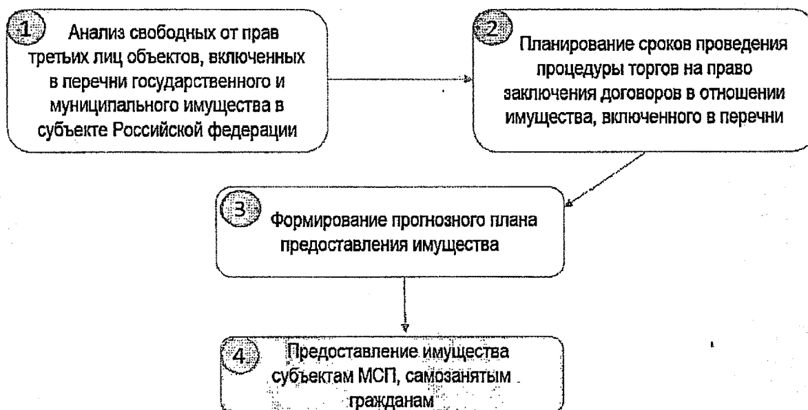
Рисунок 2. Схема формирования прогнозного плана предоставления имущества

Приложение: формы прогнозных планов на 2 л.